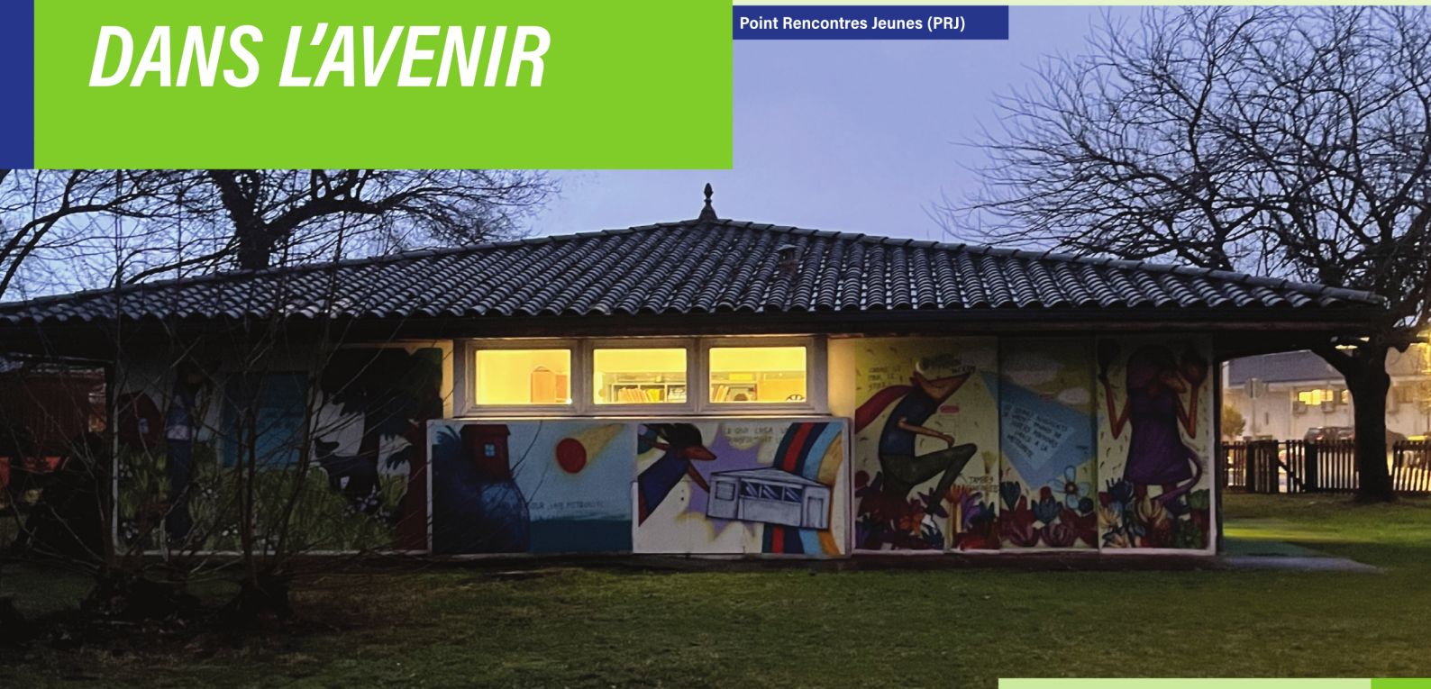
Point Rencontres Jeunes (PRJ)