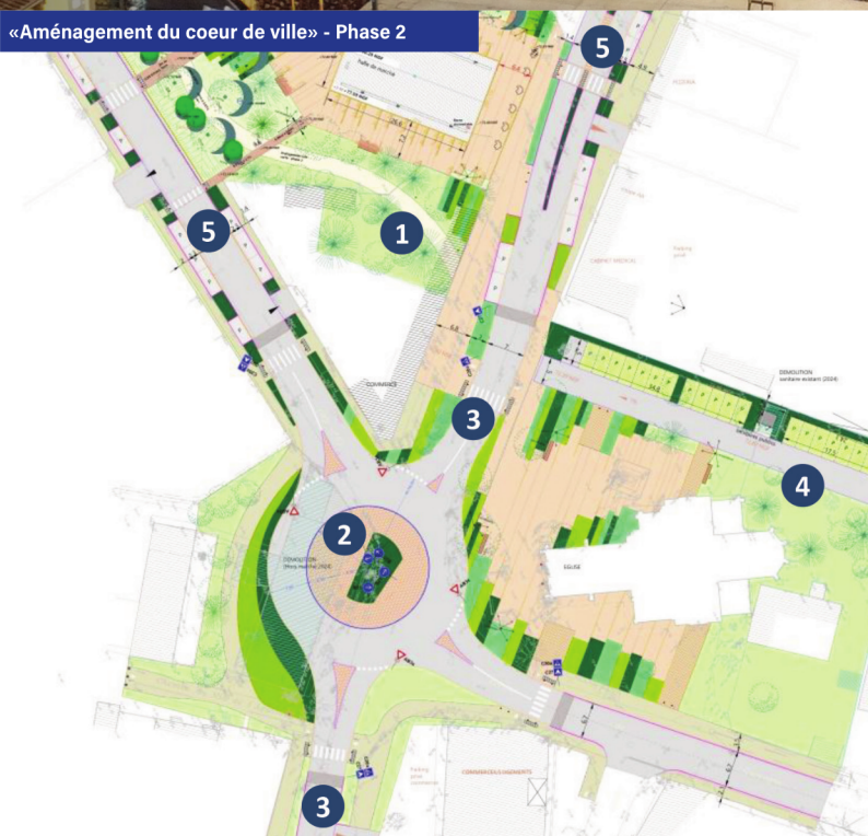
«Aménagement du coeur de ville» - Phase 2