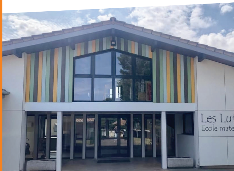
Les Lutins Ecole maternelle